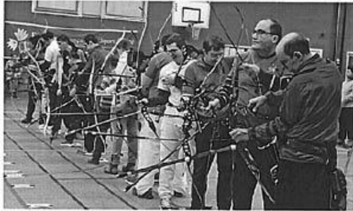
Une journée en faveur du sport pour tous qui s'est terminée dans le bonno humour autour des podiums et des récompenses pour les archers et les pongistes.