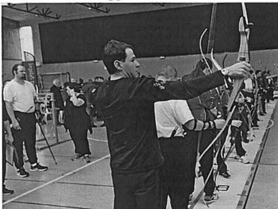
Tir à l'arc et tennis de table seront au programme de cette nouvelle édition.